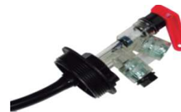
KIT SUCCIÓN-RETORNO GENERACIÓN.