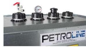
KIT SUCCIÓN-RETORNO GENERACIÓN.