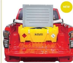
Carrytank 220 Pick-up

Contenedores de polioil lona específicos para transporte en camionetas pick-up de diesel, con exención total ADR